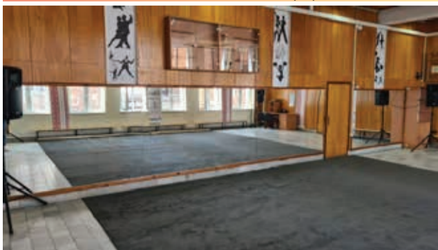
Център за подкрепа на личностното развитие – Общински детски комплекс /ЦПЛР - ОДК - Пещера, приключи дейностите по спечеления пред МОН проект за осигуряване на сред-

ства, нужни за предоставяне на съвременни условия в подкрепа на личностното развитие на децата и преподавателите и институциите в системата на предучилищното и училищното възпитание.