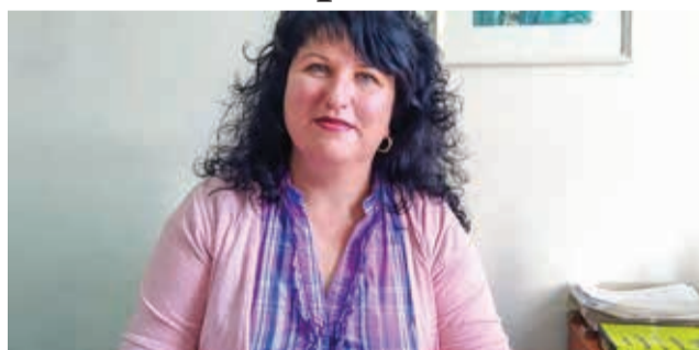
Общинска администрация. Омъжена, с едно дете.

Тя е завършила висше образование в Югозападен университет „Неофит Рилски“ в Благоевград. В Община Пещера работи от месец септември 1998 г. От 2009 до 2011-а работи в системата за закрила на детето в Агенцията за социално подпомагане. До настоящия момент е директор на Дирекция за хуманитарни дейности в Об-