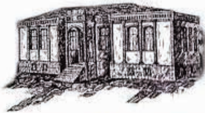
Гръцкото училище в Пещера

Константинос Саитидис. Идвайки в Асеновград, Саитидис методически организира обучението и дава категорично неговата насока - издигане в култ на