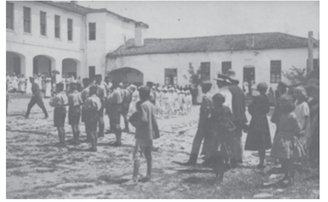
Руската гимназия в двора на казармата

Вътрешният ред бил подобен на кадетски корпус в руски патриархален дух. Това е пълен интернат с домашна църква, лекар-