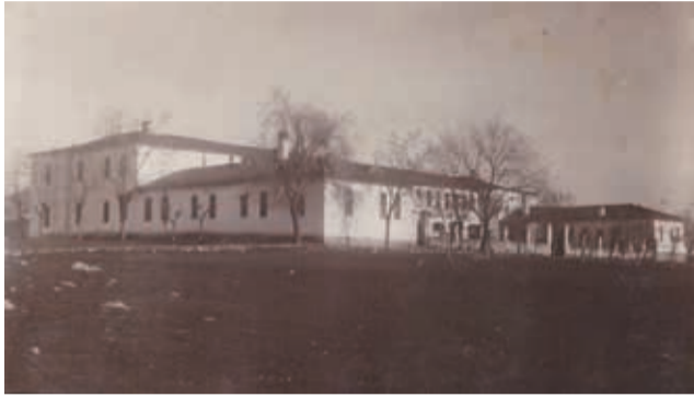
Руската гимназия в Пещера 1922-1934 г.

През 1921 г. по улиците на тихия и спокоен град Пещера започват да се появяват хора, драстично отличаващи се от коренното население. Те са предимно мъже във военна униформа със съответната стойка, говорещи на руски. Настанени са в местната казарма. Тя е опразнена от Българската армия, защото по рестриктивните условия на Ньойския договор нейният числен състав е сведен до минимум.