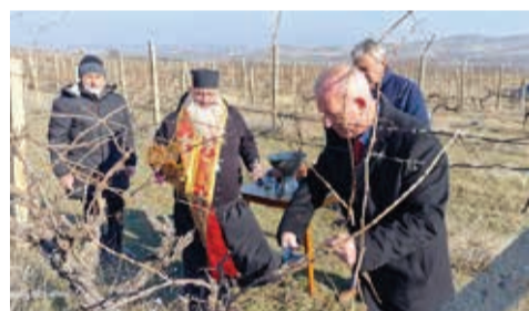
С пожелание за здраве и берекет във всеки дом и плодородна година