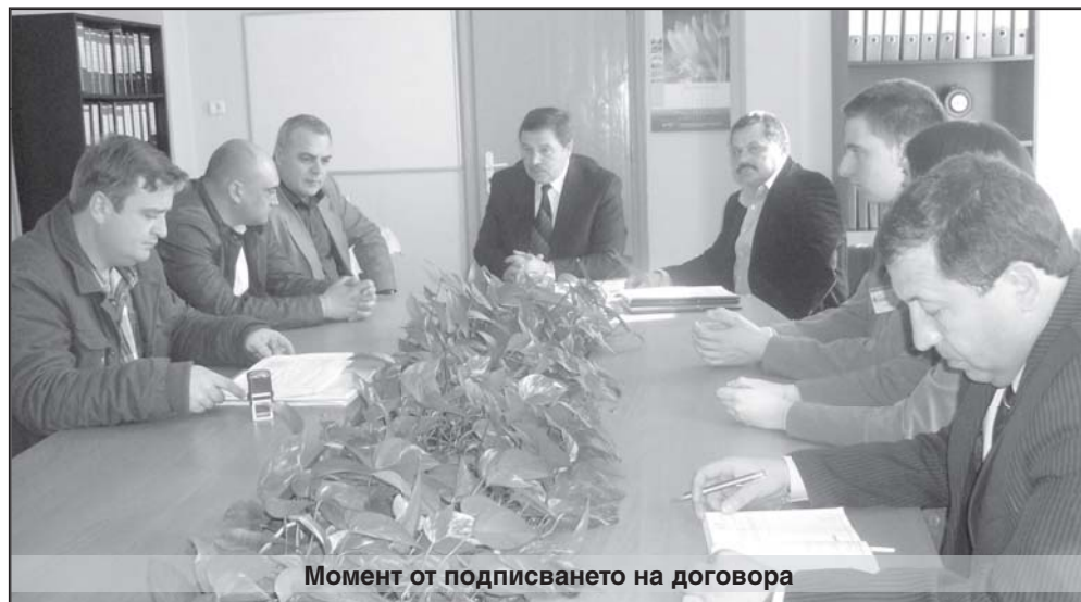
Момент от подписването на договора

Успоредно се сключва договор с Надзорна фирма за осъществяване на строителен надзор на същия обект.