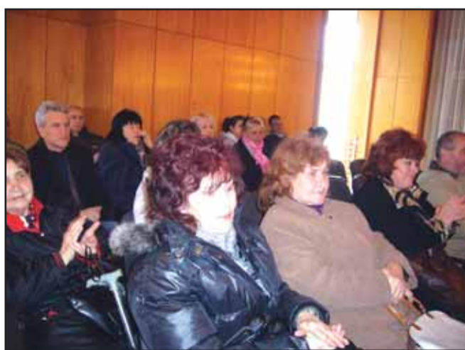
Част от присъстващите на музикалната вечер

биографията и огромното творчество на композитора - носител на най-висо-