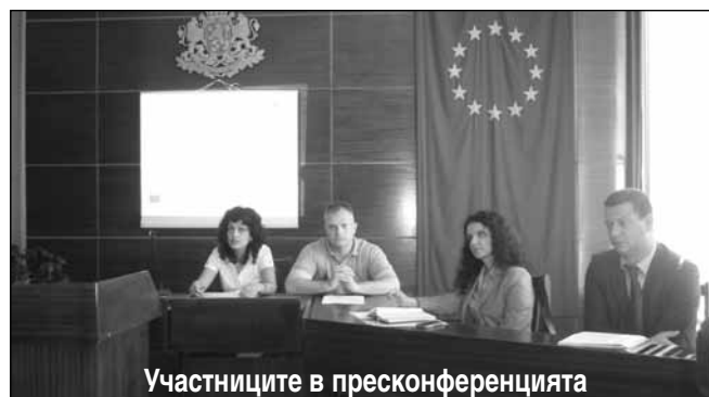
Участниците в пресконференцията

Бяха обучени 10 експерти от администрацията на община Пещера, които ще отговарят за работата на системата. Системата за е-управление вече работи